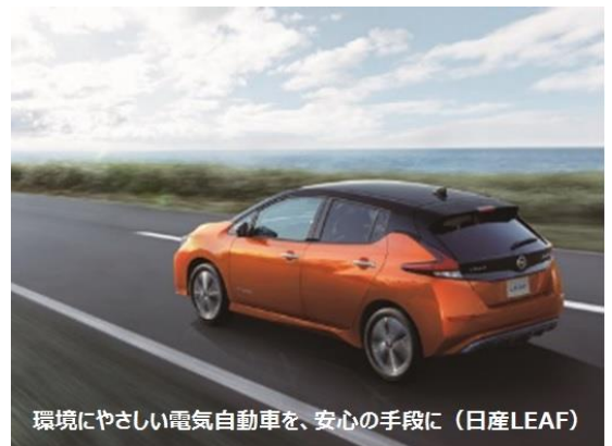
環境にやさしい電気自動車を、安心の手段に (日産LEAF)

with コロナ時代においては、プライベートな空間が確保できる移動手段として、新しいクルマの価値が注目されています。また、ガソリンをまったく使わない電気自動車での旅行は、ホテル滞在中に充電することができるため、旅先での時間を有効活用できることに加え、CO2 を排出ゼロであることで観光地の環境にも配慮した旅を実現します。地球環境への関心が高まっている今こそ、お勧めしたいクルマです。なお、この旅行商品は、神奈川県内 33 箇所の NISSAN e-シェアモビステーションからご出発いただけます。