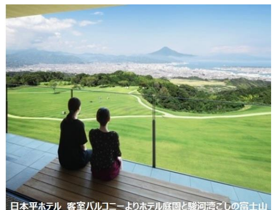
日本平ホテル 客室バルコニーよりホテル庭園と駿河湾越しの富士山

日産自動車と近畿日本ツーリストは、本企画を実施することで、新型コロナウイルス拡大により、厳しい環境にある宿泊施設も支援します。